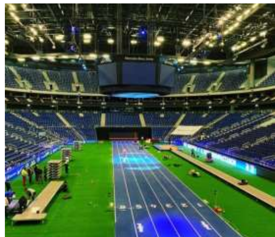
Die Ruhe vorm Sturm beim ISTAF INDOOR

Der Berliner Leichtathletik Verband hat zusammen mit der Senatsverwaltung für Sport, dem Management der Mercedes-Benz-Arena und TOP Sportmarketing sich dazu entschlossen, die Rolle des Veranstalters des ISTAF INDOOR und dem ISTAF im Olympiastadion zu übernehmen. Rechteinhaber bleibt TOP Sportmarketing. Dazu wurde ein Vertrag zwischen dem BLV und TOP Sportmarketing sowie ein Vertrag zwischen dem BLV und dem Management der Mercedes-Benz-Arena unterschrieben. Nach einer Einigung der Beteiligten wird der Vertrag im Sinne des BLV auch vom Senat abschließend geprüft. Ziel der Bemühungen des BLV ist es, einen Beitrag zur Durchführung der Veranstaltung zu leisten aber gleichzeitig alle finanziellen und rechtlichen Risiken vom Verband fernzuhalten.