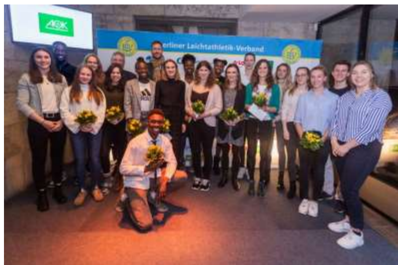
LOTTO Team Berlin und DeGeWo Junior Team Berlin 2020

Sobald uns der Link vorliegt, werden wir diesen interessierten Mitgliedern zur Verfügung stellen, um an dem virtuellen Empfang teilnehmen zu können.