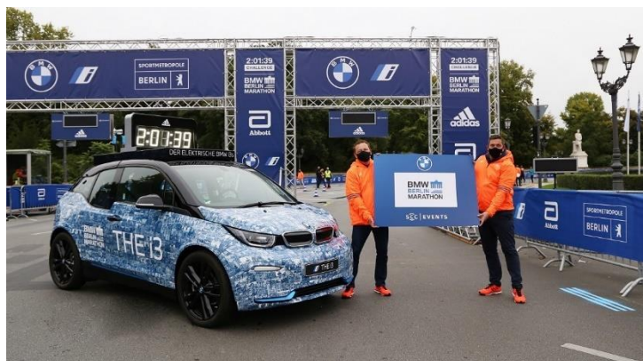
Vertragsverlängerung zwischen BMW und SCC Events.

BMW und SCC EVENTS, Veranstalter des BMW BERLIN-MARATHON, haben die Verlängerung der seit 2011 bestehenden Titelpartnerschaft beim größten Marathon Deutschlands bekannt gegeben.