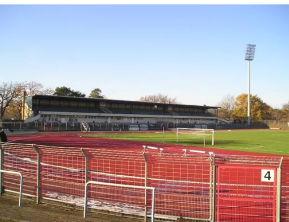
Im Oktober und November neue Laufformate im Mommsenstadion

Am 10. November findet um 18 Uhr ein 60-Minuten-Lauf im Mommsenstadion statt. Anmeldeschluss ist der 5.11.