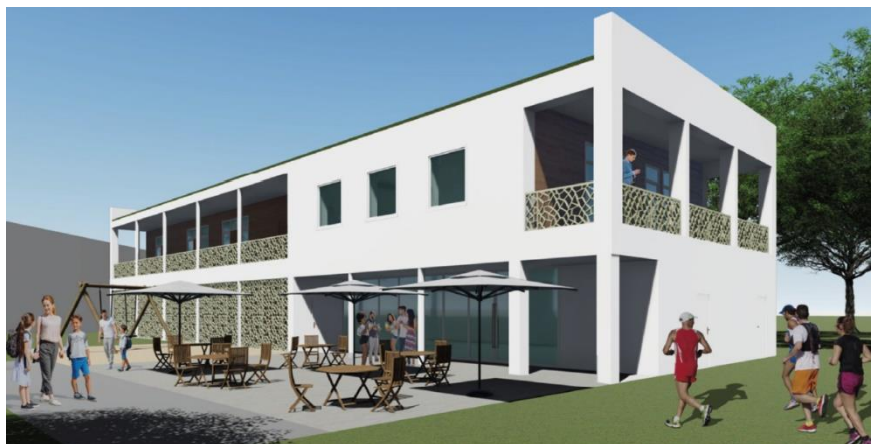
Entwurf für die neue Hockeybaude (Architektenbüro Detlef Münnich)

Das Präsidium des SCC Berlin hat die Abteilungsvorstände des SCC gebeten, sich nochmals eine Auffassung zum Umbau der Hockeybaude zu bilden. Auf der letzten Delegiertenversammlung des SCC gab es einen einstimmigen Beschluss zum Umbau der Hockeybaude. Das Casino, Umkleidekabinen und Nasszellen sollen im Erdgeschoß errichtet werden. Im ersten Stock sind zwei Versammlungsräume und zwei Büros vorgesehen. Das Gebäude soll behindertengerecht sein. Allen Abteilungen soll ein Mitnutzungsrecht eingeräumt werden. Eine finanzielle Umlage auf die Abteilungen ist ausgeschlossen, so wie eine Anhebung der Mitgliedsabgaben an den Hauptverein.