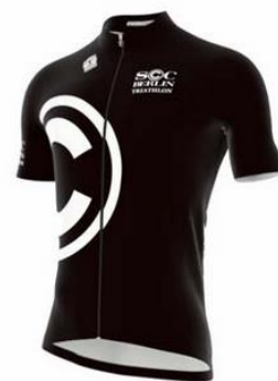
Radtrikot der neuen Kollektion

In den vergangenen Wochen war Vorstandsmitglied und TriKids-Trainerin Nina Perlitt sehr fleißig. Neben der Erstellung der individuellen Trainingspläne für die Triathleten während der Corona-Zeit, hat sie zusammen mit TriKid-Vater Andreas Nagel an einer neuen SCC-Triathlonkleidung gearbeitet. Neben den bereits bestellten Triathloneinteilern wird derzeit ein Webshop mit weiterer Triathlonausstattung eingerichtet. Dieser befindet sich in den letzten Zügen. Sobald der Webshop online ist, werden alle Triathleten mit den notwendigen Informationen versorgt.