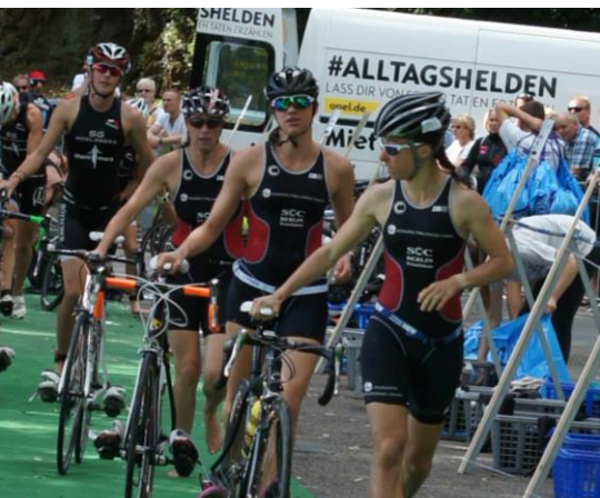
Unsere Damen sind bereit!